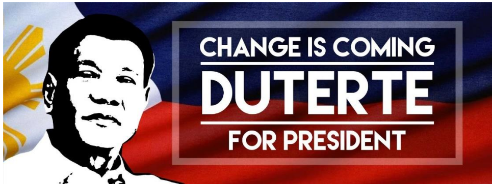
附表 5 - 杜特尔特竞选活动封面图片示例 49

虽然阿基诺政府实现了破纪录的经济增长，并在 2010 年至 2016 年间实施有条件的现金转移 (Conditional Cash Transfers) 和 K-12 基础教育计划等 (K to 12 Basic Education Program) 具有里程碑意义的改革 50 ，但人们并未感受到包容性增长。 51 一位前高级官员承认，“处理问题的速度极其缓慢，对城市中产阶级较关注的问题尤为如此”。 52 菲律宾备受全球称赞的增长被国内最富裕的人吸收，2013 年 76% 新创造的增长流向四十个最富裕家庭。 53 很多菲律宾人并未在日常生活中感受到进步。 54 《杜特尔特的崛起》 ( Rise of Duterte ) 一书描述了 2016 年大选期间出现的政治不满——“对阿基诺政府的愤怒不如对所谓的“卡西克民主疲劳”那么强烈——这是对统治后马科斯政权的自由党精英的愤怒。” 55