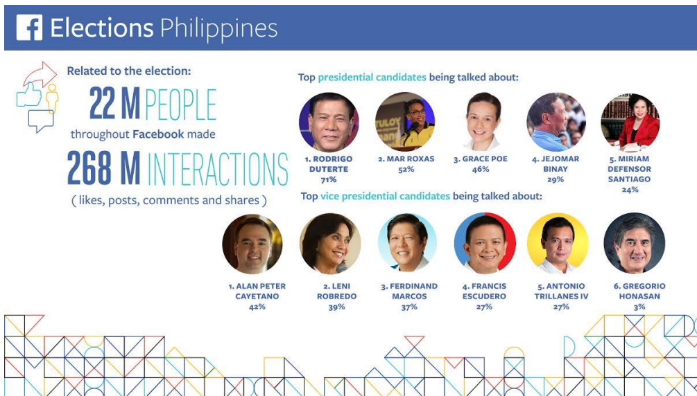
附表 3 - 2016 年 5 月 9 日 Facebook 对话的统计数据 25

根据一份全球有组织的社交媒体操纵清单，我们发现杜特尔特的社交媒体手段“形式与策略前后一致，全年雇佣全职员工控制信息空间。” 26 此次竞选活动中最著名的博主（如摩卡·尤逊（Mocha Uson））以关键消息为标题，得到了无数网页和用户追捧。