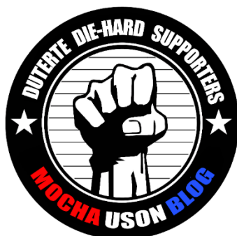
附表 6 - 杜特尔特支持者中最著名的 Facebook 页面博主摩卡·尤逊 (Mocha Uson) 的个人资料图片

他为“ Tatay Digong ”或“杜特尔特父亲”。病毒式帖子利用真实账户和虚假页面，轻易吸引无数狂热的追随者。 59 著名自由党政治家和异见人士受到公开骚扰，成为定期网络攻击的受害者。 60 虽然很多支持者只为自己所选的候选人奔走呼号，但有害行为的例子比比皆是。 61