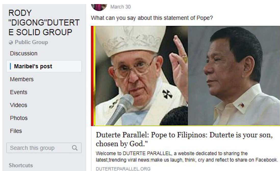
附表 4 - 虚假新闻文章示例 47

享。 45 附表 4 例举了一篇虚假新闻文章的示例。因而，显著性偏差和卡尼曼所说的‘所见即所有’都表达了人们根据眼前的事物形成判断、印象甚至信念的倾向，该现象在社交媒体平台上泛滥。 46